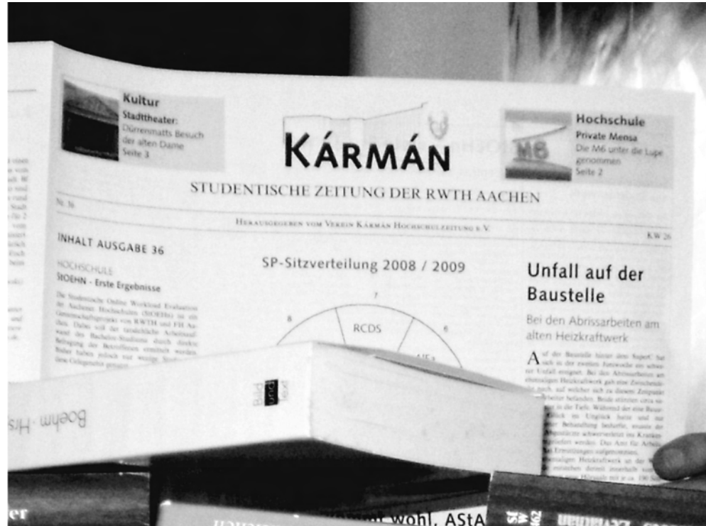
Alle zwei Wochen Pflichtlektüre an der RWTH - Die Kármán